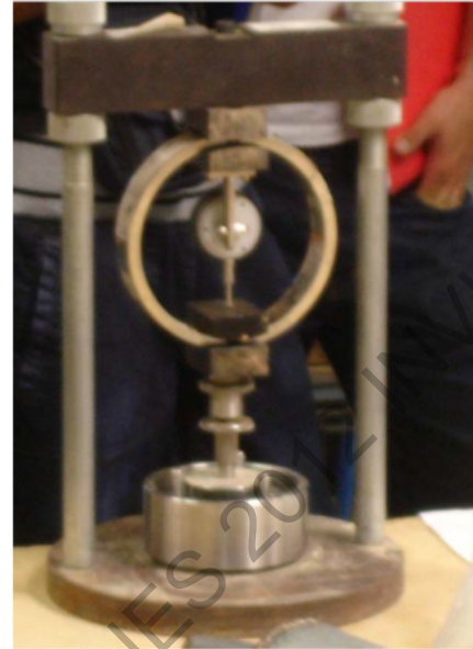
Figura 120 - 2. Aparato de Lambe