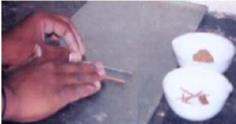
Figura 126 - 3. Método manual para formar rollos de suelo

8.2.2 Empleando el aparato de enrollamiento – Se adhieren hojas de papel mate liso a las placas superior e inferior del aparato plástico de enrollamiento. Se coloca la masa de suelo sobre la placa inferior, en el punto medio entre los rieles de deslizamiento. Se coloca la placa superior en contacto con la masa (o masas, ver nota 3) de suelo. Simultáneamente, se aplica una ligera presión hacia abajo y se da a la placa superior un movimiento de vaivén, de manera que entre en contacto con los rieles laterales antes de que pasen dos minutos (notas 1 y 3). No se debe permitir que el suelo toque los rieles laterales durante el proceso de enrollamiento. Si esto ocurre, se debe enrollar una masa de suelo más pequeña (aun si ella resulta menor que la mencionada en el numeral 8.1).