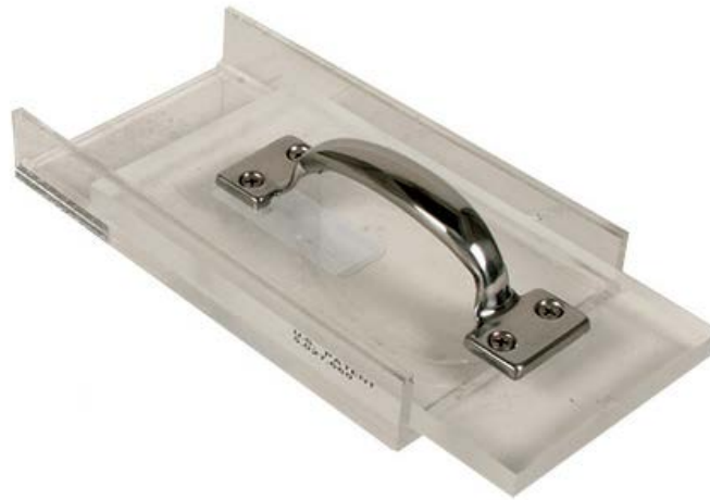
Figura 126 - 1. Aparato de enrollamiento para determinar el límite plástico