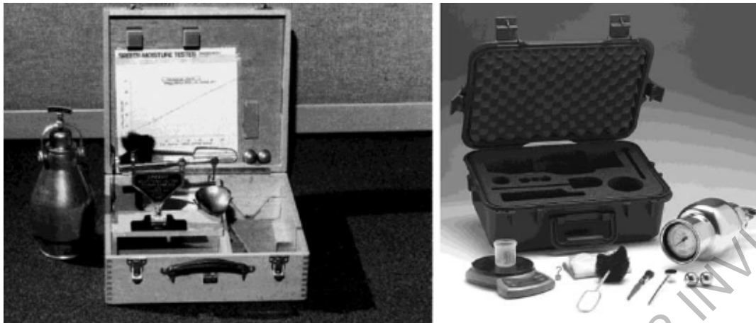
Figura 150 - 1. Probadores de carburo de calcio