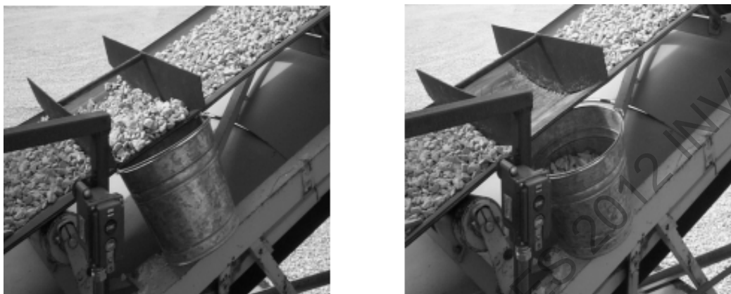
Figura 201 - 2. Muestreo en una banda transportadora

requerida. Todo el material que quede entre los dos elementos se deberá recoger en forma cuidadosa, colocándolo en un recipiente apropiado (Figura 201 - 2). Los finos que queden sobre la banda se deberán recoger en una bandeja con ayuda de una brocha y se deberán incorporar a la muestra contenida en recipiente.