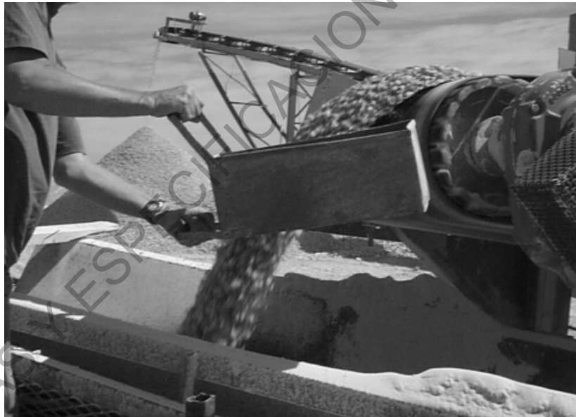
Figura 201 - 1. Muestreo en un flujo de descarga

Nota 5: Se debe evitar la toma de muestras de la descarga inicial o final de tolvas o bandas transportadoras, pues al hacerlo se aumentan las posibilidades de obtener material segregado.