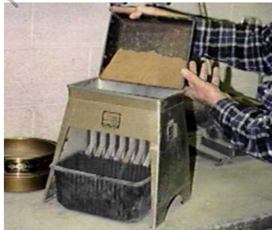
Figura 202 - 3. Distribución del agregado en la canaleta alimentadora