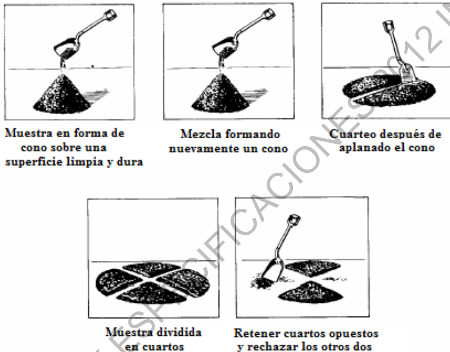
Figura 202 -4. Cuarteo manual sobre superficie limpia, dura y nivelada

palo o tubo (lo que se haya empleado) dejando un doblez de la lona entre las dos porciones. Se inserta nuevamente el palo o tubo por debajo del centro de la pila ortogonalmente a la primera división y, de nuevo, se levantan los extremos del palo o tubo dividiendo, de esta manera, el material en cuatro partes iguales. Se retiran dos cuartos diagonalmente opuestos, teniendo cuidado de limpiar cuidadosamente el material fino que queda en la lona. Se mezcla y se cuarteo sucesivamente el material restante, hasta que la muestra quede reducida al tamaño deseado (Figura 202 - 5).