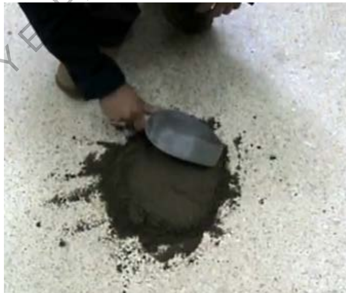
Figura 202 - 6. Aplanamiento de la pila miniatura