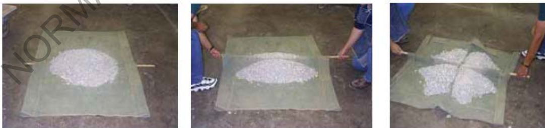
Figura 202 - 5. Cuarteo manual sobre una lona