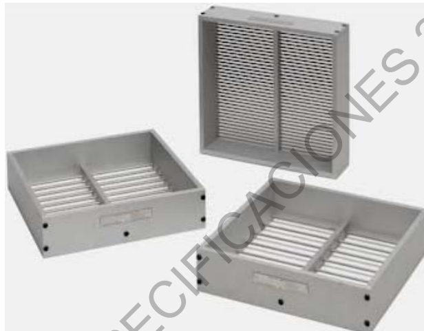
Figura 230 - 1. Tamices de barras