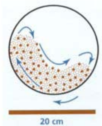
Figura 238 - 1. Degradación del agregado durante el ensayo Micro-Deval

pasa el tamiz de 1.18 mm (No 16), expresada como porcentaje de la masa seca original de la muestra.