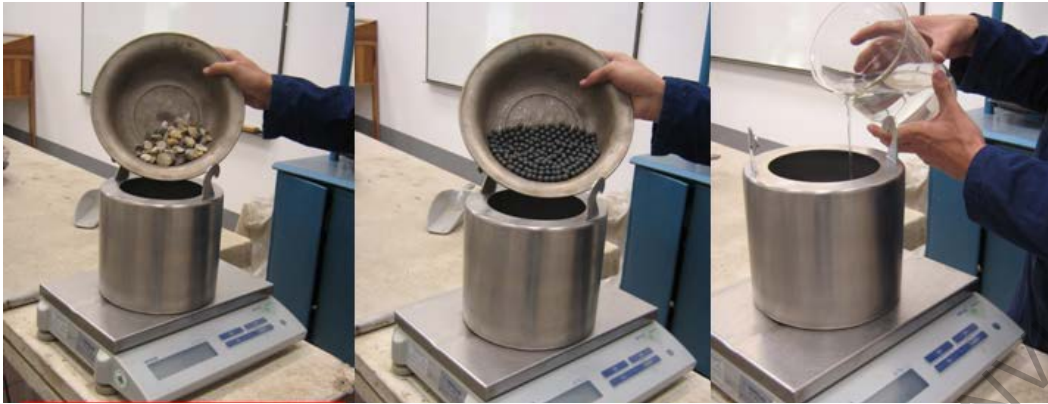
Figura 238 - 3. Colocación de la muestra, la carga abrasiva y el agua dentro del recipiente cilíndrico