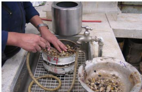
Figura 238 - 4. Lavado de la muestra y las esferas sobre los tamices