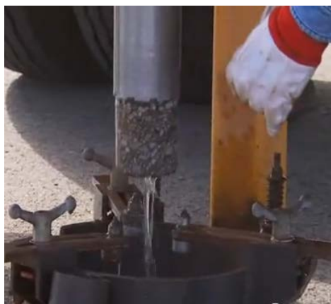
Figura 758 - 1. Taladro saca-núcleos