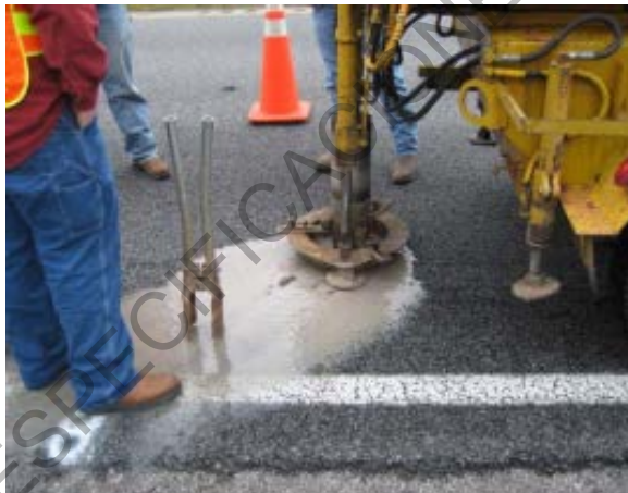
Figura 758 - 4. Ejemplo de dispositivo para extraer un núcleo de pavimento