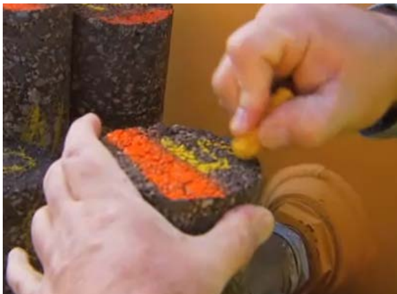
Figura 758 - 5. Identificación un núcleo de pavimento