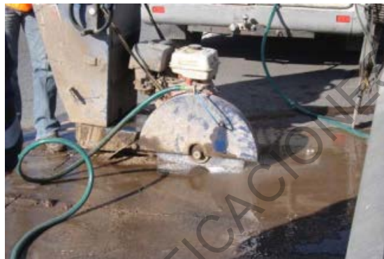
Figura 758 - 2. Aserrado para la toma de un testigo del pavimento