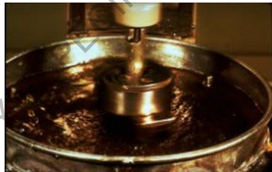
Figura 778 - 3. Ensamble de la cabeza de caucho abrasiva

Nota 4: Se debe emplear un trozo nuevo de manguera para cada ensayo, aunque se permite un segundo ensayo utilizando la superficie virgen superior de la manguera, girándola 180^\circ .