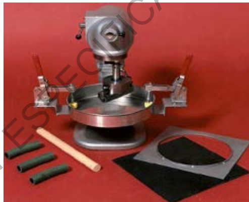
Figura 778 - 1. Equipo de abrasión por vía húmeda