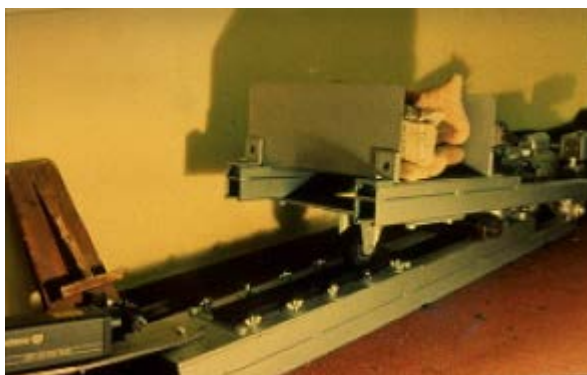
Figura 779 - 3. Compactación de la probeta