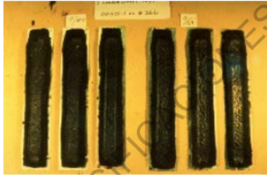
Figura 779 - 5. Probetas luego del ensayo