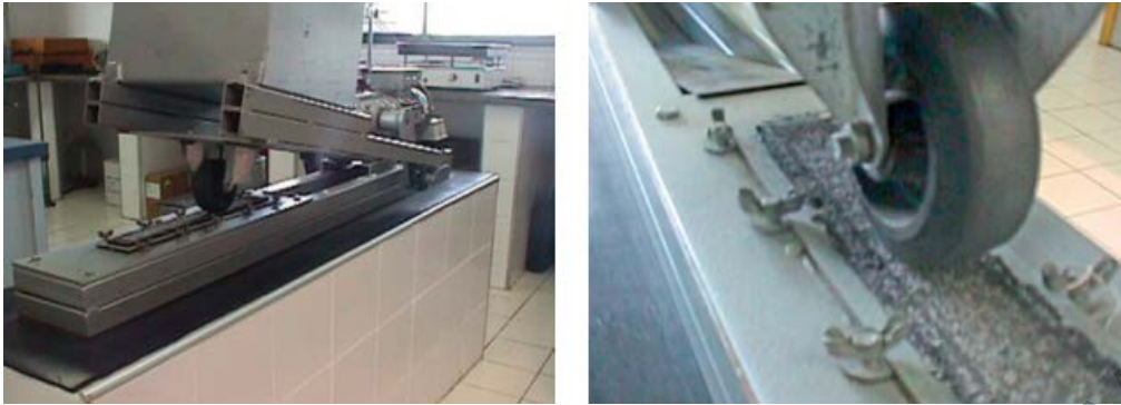
Figura 779 - 4. Rueda actuando sobre la capa de arena