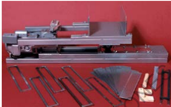
Figura 779 - 2. Máquina y accesorios para el ensayo de rueda cargada