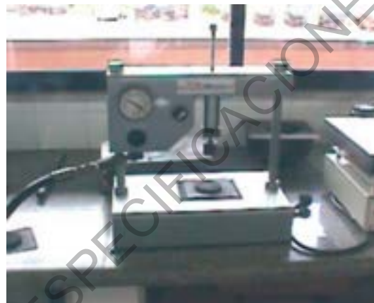
Figura 780 - 1. Cohesiómetro para ensayo de lechadas asfálticas