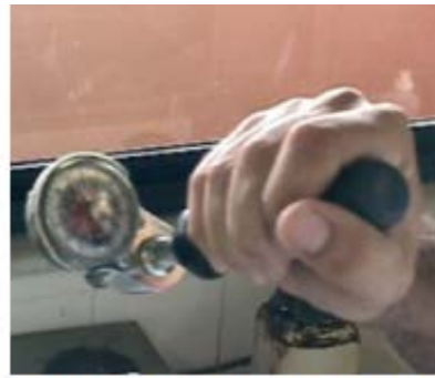
b. Verificación del par de torsión