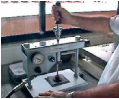
a. Ejecución del ensayo