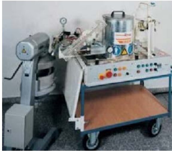
Figura 785 - 1. Planta de laboratorio para producir asfalto espumado