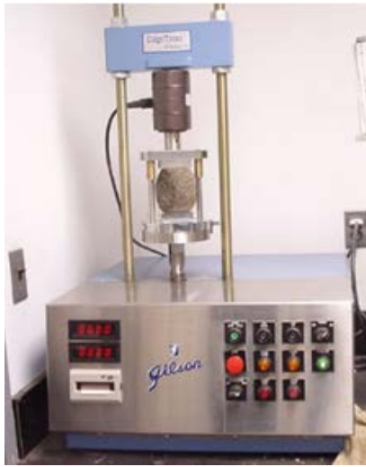
Figura 785 - 3. Ensayo de tensión indirecta