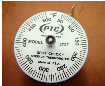
Figura 788 - 4. Termómetro de disco tipo spot check