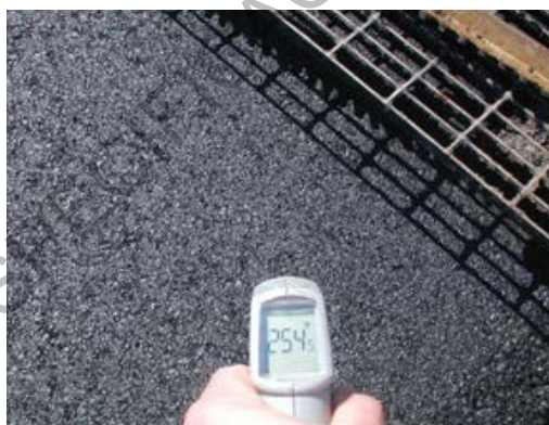
Figura 788 - 1. Termómetro infrarrojo