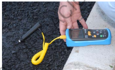
Figura 788 - 5. Termómetro digital