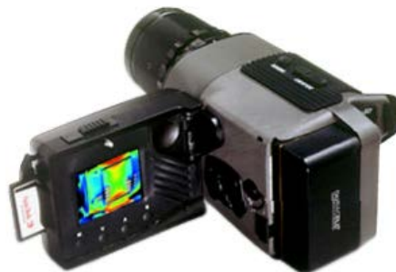
Figura 788 - 6. Cámara termográfica