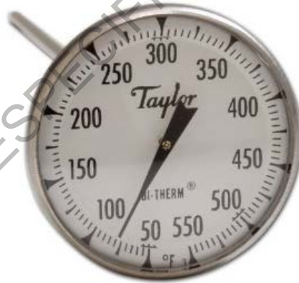
Figura 788 - 3. Termómetro bi-therm