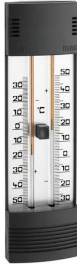
Figura 788 - 2. Termómetro de máximas y mínimas