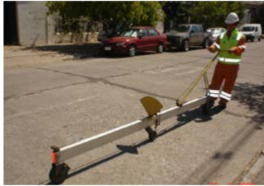
Figura 793 - 2. Regla rodante en operación